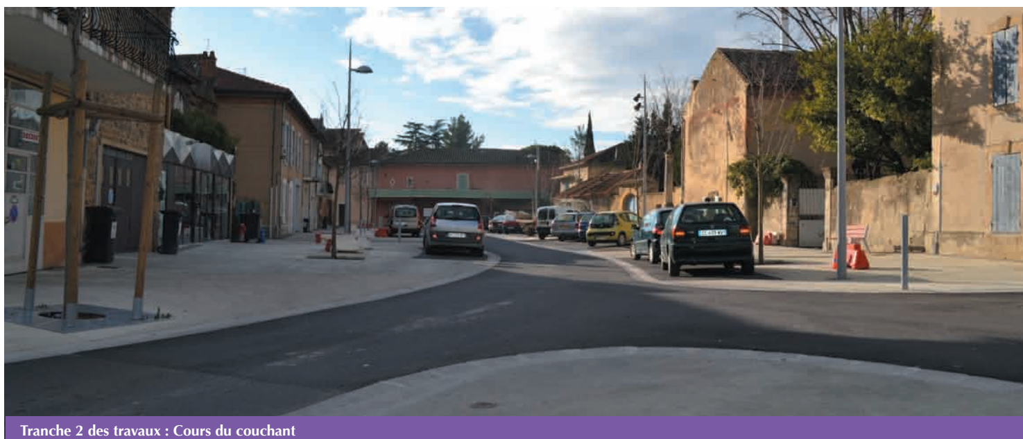
Tranche 2 des travaux : Cours du couchant

Les travaux d'enfouissement sur la rue Marie Curie se poursuivent, les enrobés et la création d'un cheminement piétonnier seront finalisés fin mars. Les travaux du tour de ville reprendront au cours du 2 ème trimestre. ●