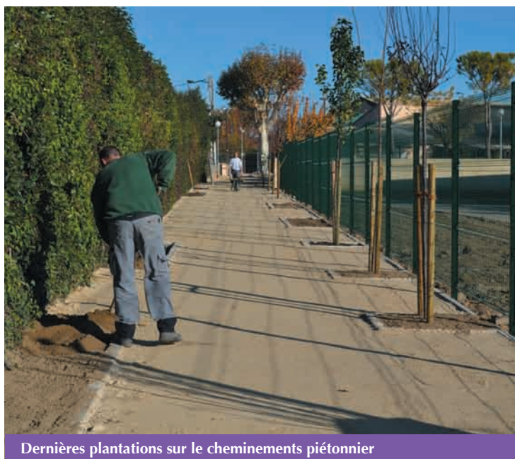
Dernières plantations sur le cheminements piétonnier