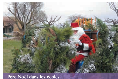
Père Noël dans les écoles