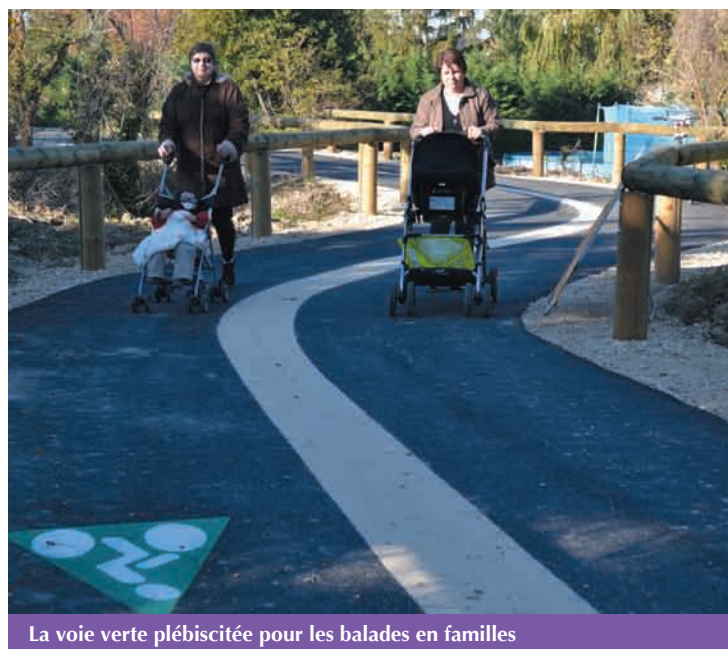
La voie verte plébiscitée pour les balades en familles