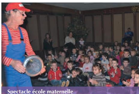
Spectacle école maternelle