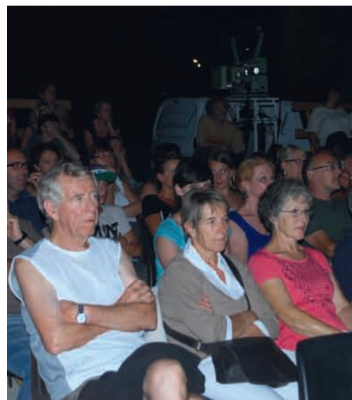
5, 12, 19, 26 juillet : Séances de cinéma gratuites en plain air