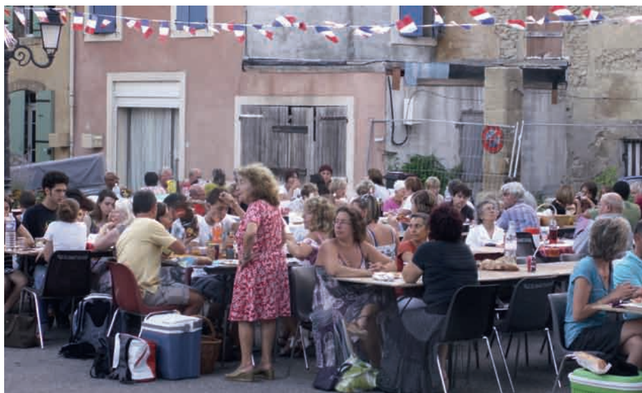
13 juillet : Pique nique sur la place St Andéol