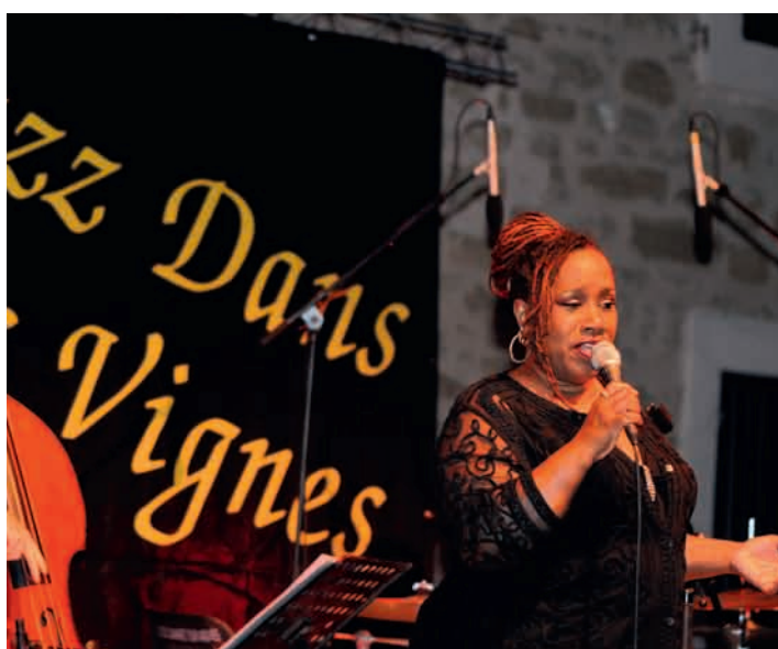
3 août : Concert dans la cadre de Jazz dans les vignes