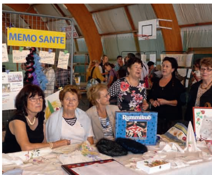
2 septembre : Matinée des associations