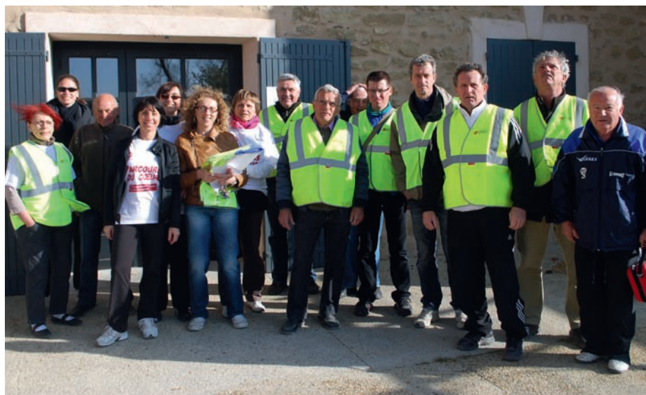
1 er avril : Parcours du coeur