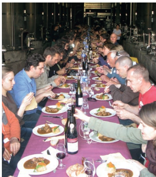
Du 28 au 30 avril : 4 ème fête du Plan de Dieu. Plus de 200 personnes à la soirée tapas, près de 1000 participants à la balade gourmande...