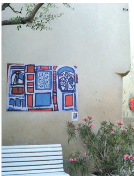
22 au 24 juin : L'art différencié dans la rue