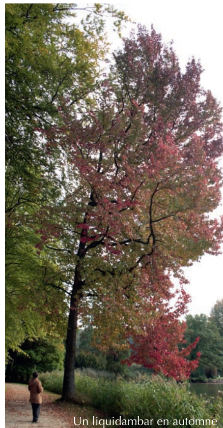
Un liquidambar en automne

Comme dans beaucoup de communes provençales, les sujets abattus ont été remplacés par des micocouliers, une essence méditerranéenne naturellement immunisée contre les maladies des platanes, le chancre coloré en particulier (champignon arrivé en 1944 avec les américains qui fait des ravages). Le micocoulier est un arbre d'ornement qui s'étoffe rapidement. De plus, son système racinaire pose beaucoup moins de problèmes de soulèvement des revêtements de surface. A l'angle du cours du Nord et de la rue du Parc, le choix s'est porté sur un Liquidambar, une essence également peu sensible aux maladies, au port fastigié, qui se pare à l'automne de belles couleurs rouges caractéristiques. ●