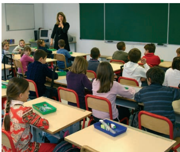
Une 7 ème classe à l'école Mistral,