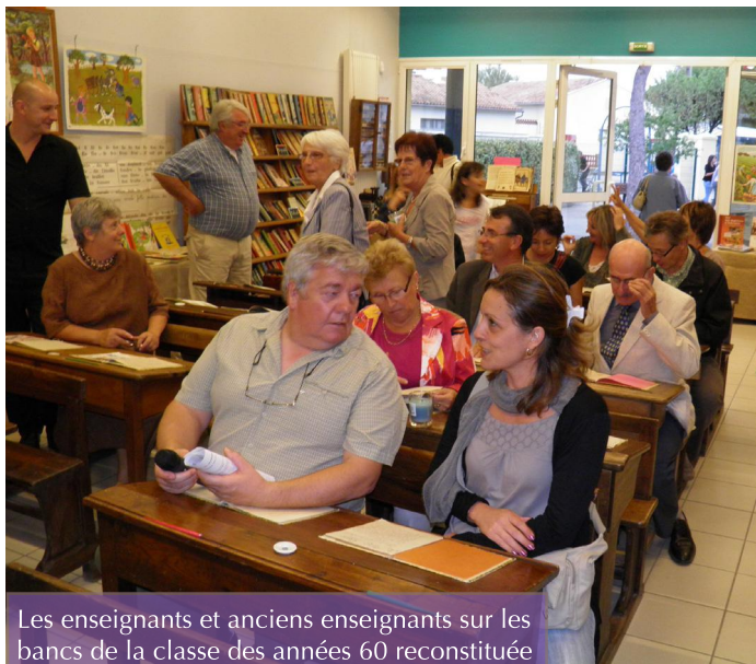
Les enseignants et anciens enseignants sur les bancs de la classe des années 60 reconstituée

Malgré l'appel de M. Boulinguez, beaucoup des 346 photos de classes manquent encore. Si vous détenez l'une d'elles, vous pouvez le vérifier sur le site de l'école qui s'engage à les scanner et vous les restituer de suite. Vous pouvez aussi la leur adresser par email si elle est déjà numérisée. ●