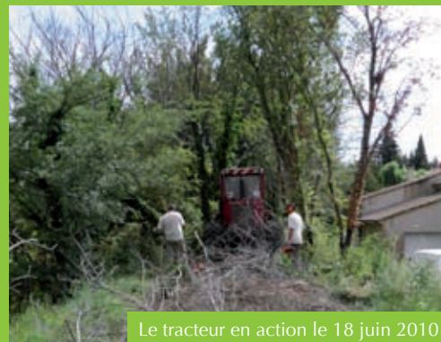
Le tracteur en action le 18 juin 2010

Le syndicat mixte forestier réalise actuellement les travaux de débroussaillage de l'ancienne voie ferrée pour la rendre accessible aux piétons et aux VTT. Un travail de longue haleine qui rappelle l'extraordinaire chantier qui, à l'époque, avait permis de relier Orange à Vaison-la-Romaine et Buis-les-Baronnies par la voie ferrée. La construction du petit train de Buis fut l'aboutissement d'une lutte entamée dès 1860. Trente ans d'innombrables démarches permirent la signature le 16 juillet 1896 de la déclaration d'utilité publique du chemin de fer Orange – Vaison-la-Romaine – Buis-les-Baronnies. Les travaux de construction débuteront en avril 1904 et dureront près de 3 ans avant l'inauguration officielle le 10 mai 1907.