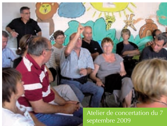
Atelier de concertation du 7 septembre 2009

La stratégie globale fera l'objet d'une réflexion approfondie à la rentrée. Une réunion publique sera alors organisée. En attendant, tous nos efforts sont portés sur la mise en place d'une action concrète : études opérationnelles en faveur des économies d'énergie. ●